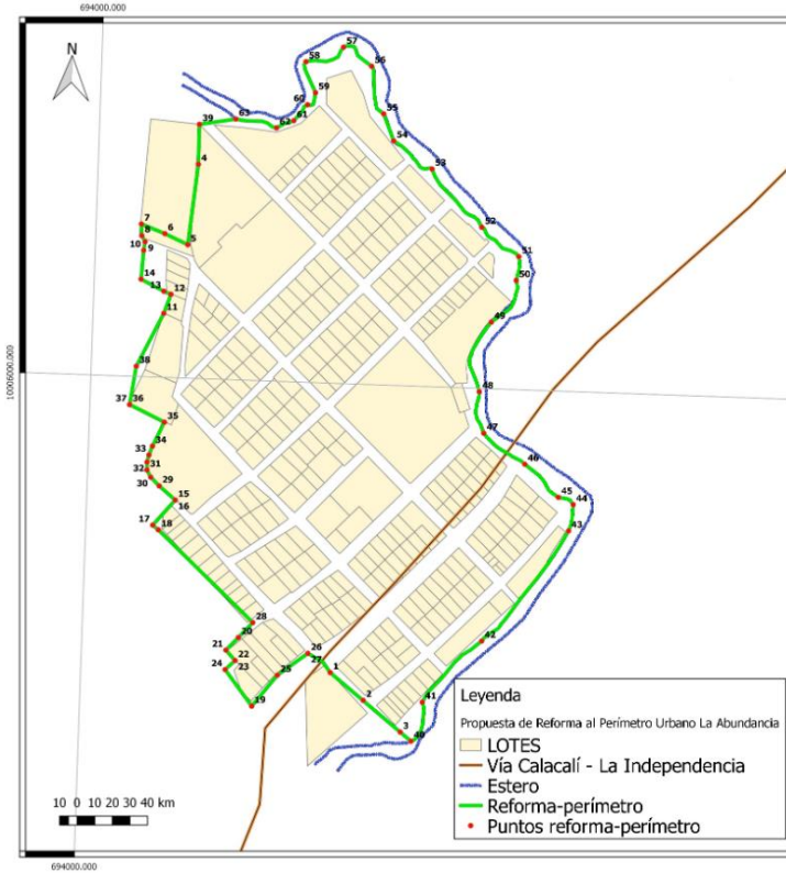
Gráfico No. 02 Límites del área urbana del Recinto La Abundancia